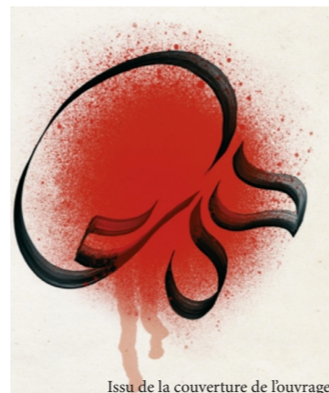
Issu de la couverture de l'ouvrage

«Nous vivons des temps apocalyptiques. Dans le magma des événements du monde, une alternative politique se dessine : fascisme ou révolution. Le fascisme, c'est ce vers quoi nous entraîne le cours de démocraties de moins en moins libérales, de plus en plus soumises à la loi du capital. Depuis les années 1970, celui-ci est entré dans une logique de guerre. Ainsi est-il devenu, par la puissance que lui confère la financiarisation, une force politique vouée à la destruction des liens sociaux, des individus, des ressources et des espèces. Cette offensive fut rendue possible par la fin du cycle des révolutions. Mais tandis qu'elle s'opérait, les pensées critiques annonçaient la pacification des relations sociales et l'avènement d'un nouveau capitalisme, plus doux, plus attentif au confort des travailleurs. Aujourd'hui, des prophètes de la technologie nous vantent même une résolution de la crise climatique ou une sortie du capitalisme par les moyens du capital. Contre ces consolations illusoire et face au fascisme qui s'installe, il est urgent de retrouver le sens des affrontements stratégiques, de reconstruire une machine de guerre révolutionnaire. Puisque le capital déteste tout le monde, tout le monde doit détester le capital.»